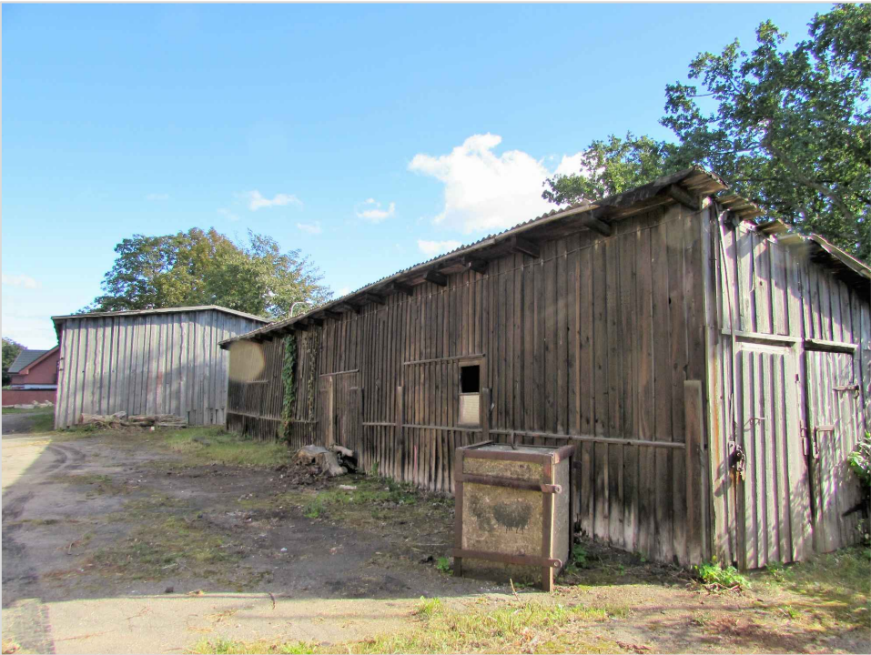
att. 33. Koka šķūnis 003 un nojume 005.