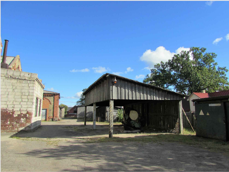
att. 32. Koka nojume 008.