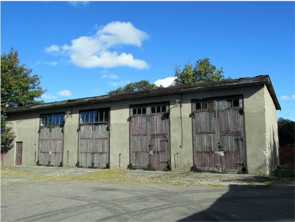
att. 35. XX gs. 2. puses garāžas 012.