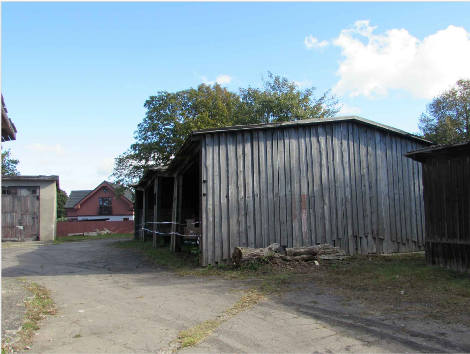
att. 34. Koka nojume 005.